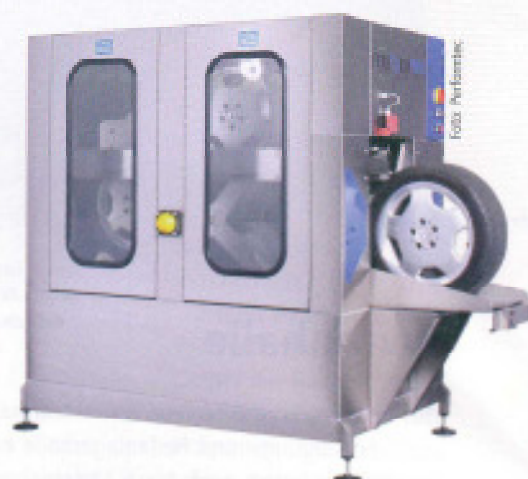
Die Performtec-Anlage für den kompletten Radsatz kann bei Bedarf auch mit weniger Rädern besetzt werden.

Die Räderwaschanlagen von Performtec sollen hier Abhilfe schaffen. Das Unternehmen aus Kirchheim bietet zwei Versionen an: Eine Anlage für einen kompletten Radsatz und eine modulare Version für ein oder zwei Räder. Beide können sowohl Stahl- als auch Aluminiumräder vollautomatisch reinigen. Es gibt keine mechanischen Waschkomponenten, die die Felgen beschädigen könnten, denn der Dreck wird durch eine chemische Hochdruckreinigung entfernt. Diese soll auch mit eingebranntem Bremsstaub fertig werden. Die Anlage neutralisiert das entstehende Abwasser selbsttätig.