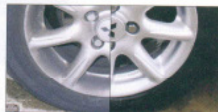
Vorher/Nachher: Mit dem professionellen Reinigerset von Clean-Easy sollen Kfz-Betriebe auch die Räderaufbereitung als Dienstleistung vermarkten können.

Ein abgestimmtes Reinigersystem für Felgen bietet Clean-Easy an. Nach Angaben des Unternehmens können die Produkte sowohl in Räderwaschanlagen als auch bei der Reinigung von Hand verwendet werden. Das Clean-Easy-Aufbereitungsset besteht aus Felgenreiniger, Versiegelung,