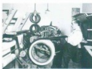
Nokian 120 Jahre S. 70