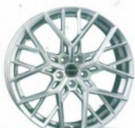
Felgen Highlights der Saison S. 118