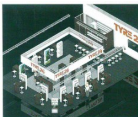
Tyre 24 hatte erst seine Messepräsenz abgesagt, jetzt aber wird doch groß aufgefahren.

Erlebbar soll auf der Premiere der THE TIRE COLOGNE die Digitalisierung sein. Was sich im Kopf erstmal abstrakt darstellt, dürfte beim Rundgang rasch an Klarheit gewinnen. Die Messemacher haben erkannt, dass kein Faktor die Branche derartig umfassend und schnell modifiziert wie die Digitalisierung. Sie sorgt aber nicht nur für eine Kannibalisierung tradierter Vertriebswege, sondern bittet eine Fülle an Möglichkeiten für Handel und Industrie. Die Präsenz der Spezialisten im digitalen Feld auf der Messe dürfte eine Vielzahl neuer Impulse liefern. So präsentiert beispielsweise die SAITOW AG mit zwei Messeständen auf insgesamt 200 Quadratmetern Standfläche ihre Antworten auf die Herausforderungen der Zukunft. Ein 168 Quadratmeter großer Kopfstand in Halle 8.1 (Standnummer D048/E049) steht ganz im Zeichen des Portals tyre24.alzura.com . Ein großes Thema der B2B-Plattform für Reifen, Felgen, Werkstattzubehör und Verschleißteile werden die neuen Account-Typen sein, die sich in ein neues Preissystem einfügen. Auf dem Marktplatz des neuen Digital Reality Bereichs, der sich ebenfalls in Halle 8.1 befindet, wird die SAITOW AG auf einem großzügigen „Inselstand“ (Standnummern: D047a-D047d ) das weitere Produktportfolio der einzelnen Geschäftsbereiche vorstellen. Dazu zählen unter anderem die Portale Autoreparaturen.de und Reifen-vor-Ort . Auf dem Inselstand erfahren die Messebesucher auch Details über die eCommerce-Komplettlösung MONDO MEDIA.