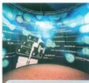
THE TIRE COLOGNE Vorschau Messehöhepunkte S. 38